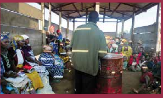
Moment d'étude biblique avant la classe d'alphabétisation; même les enfants sont attentifs!

mise des diplômés. Ces fêtes sont l’occasion pour diverses communautés chrétiennes de se fréquenter, ce qui, semble-t-il, est assez rare.