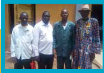
Pasteurs déportés, dans le camp de réfugiés de Kaya

nette amélioration dans ce pays d'Afrique subsaharienne. En revanche, dans le même temps et en raison de nombreuses attaques terroristes, l'insécurité a progressé. Depuis début 2018, la violence a même déplacé 289'000 habitants du nord du pays, et des milliers d'écoles ont été fermées. Fait nouveau pour cette nation qui était connue pour sa tolérance religieuse: les chrétiens sont devenus des cibles pour les extrémistes islamiques.