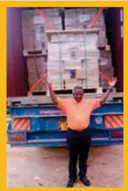
Pasteur louant Dieu pour les 19'000 Bibles qui viennent d'arriver dans sa langue!

Exercice de lecture à haute voix lors d'un cours d'alphabétisation en bbaledhā