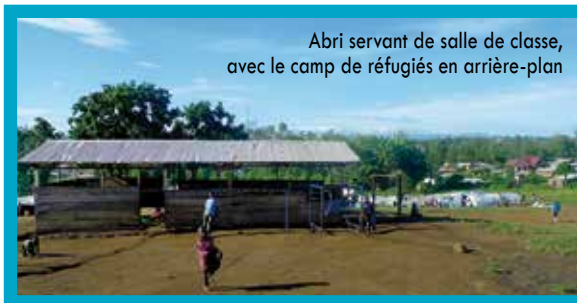
Abri servant de salle de classe, avec le camp de réfugiés en arrière-plan

Dans leur dernier rapport, les deux formateurs expriment la joie qu'ils ont éprouvée en voyant les deux populations réunies dans les églises lors des cérémonies de re-