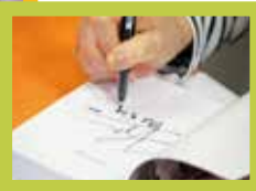
La conférence publique en Suisse, à Yverdon, le 2 octobre