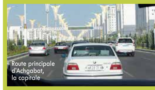
Route principale d'Achgabat, la capitale