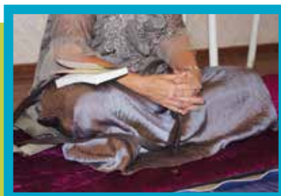
Réunion chrétienne clandestine

Rolf Zeegers, unité de recherche de PO International