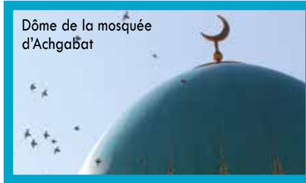
Dôme de la mosquée d'Achgabat

la Seconde Guerre mondiale, avec l'arrivée de populations déportées de Russie. Et c'est avec l'indépendance du pays, dans les années 1990, qu'est née une Eglise turkmène composée d'autochtones.