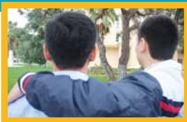
Les deux frères