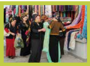
Marché de la ville

d'églises non traditionnelles, en particulier évangéliques, et 1'000 chrétiens d'origine musulmane. Ce sont eux les plus persécutés: par l'Etat, leur famille, leurs amis et la société. Ils subissent d'intenses pressions visant à leur faire renier la foi. Les femmes sont frappées, enfermées chez elles, menacées, agressées verbalement et physiquement et rejetées par leur famille.