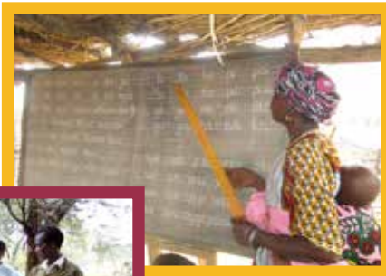
Le travail d'alphabétisation